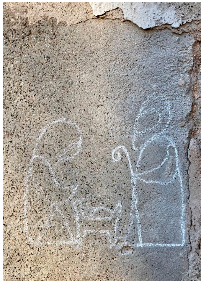
V zadní uličce na zdi biskupské rezidence v Eichstättu, Bavorsko.

Vyprávění nezůstalo bez odezvy. Ve všech hostincích, kde Marii a Josefa odmítli, měli v příštích dnech vytlučená okna